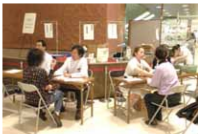
薬剤師・看護師の相談コーナー

21世紀の高齢社会を支えていくためには、看護の心、ケアの心、助け合いの心を、私たち一人一人が分かち合うことが必要です。こうした心を、老若男女を問わず誰もが育むきっかけとなるよう、旧厚生省により「看護の日」が1990年に制定されました。近代看護を築いたフローレンス・ナイチンゲールの誕生日にちなみ、5月12日となりました。