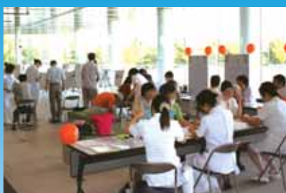
健康相談コーナー