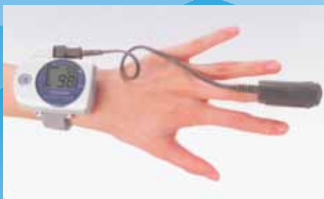
スクリーニング検査