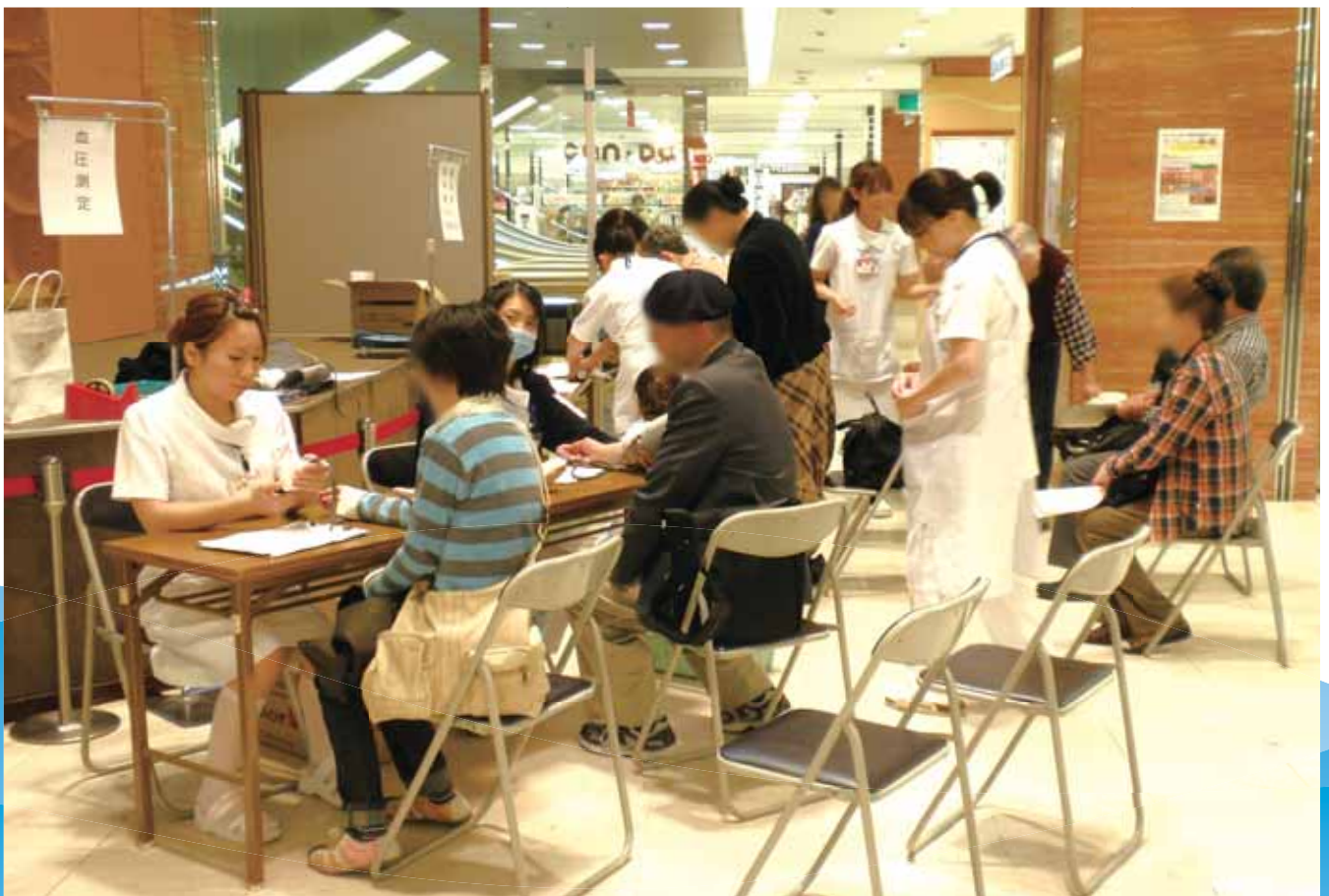
看護の日のイベント 平成22年5月14日 イトーヨーカドー奈良店 4階イベント広場