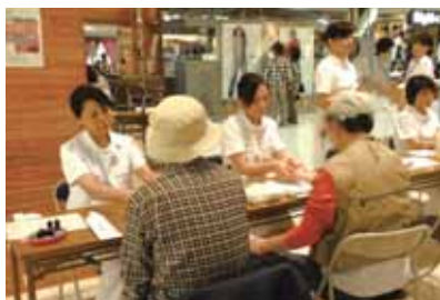
アロママッサージ実演