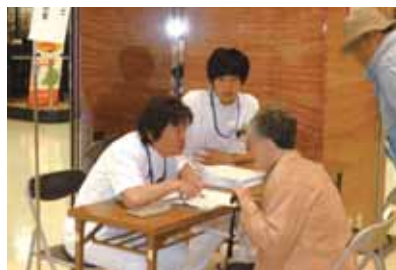
理学療法士の相談コーナー